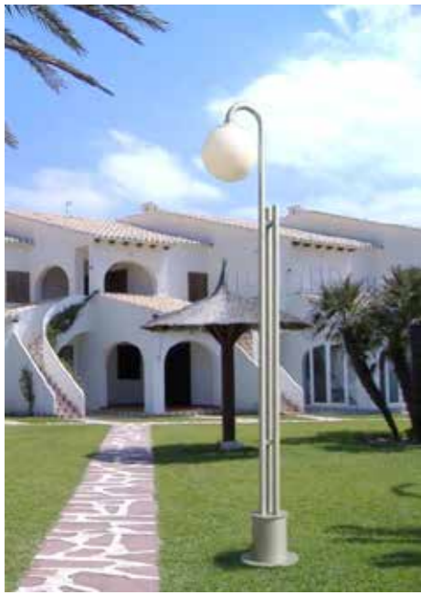
Modelo 2011 (1 Brazo)