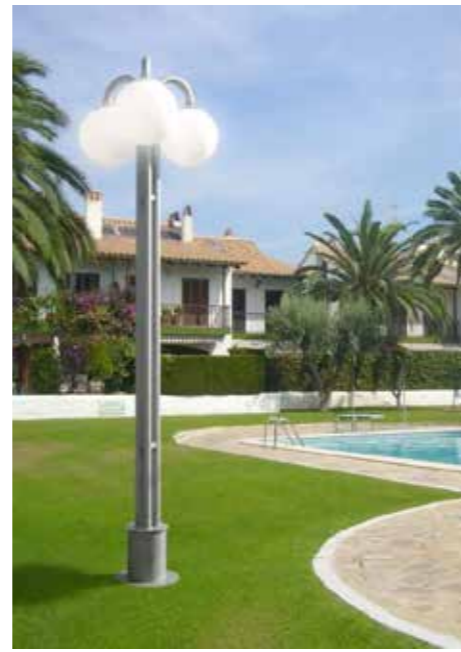
Modelo 2013 (3 Brazos)