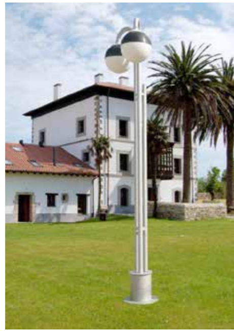
Modelo 2012 (2 Brazos)